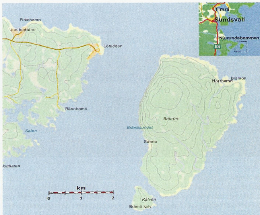
Kartbild över området Lörän, Brämön och Kalven (från RAÄ).

Brämön är Medelpads yttersta utpost i Bottenhavet. Den ligger 2 km utanför Lörän vid Njurundakusten och sundet mellan fastlandet och ön utgör den marina porten till Sundsvalls kommun. Till ön, som är 5 km lång och 3 km på sitt bredaste ställe, kan man bara ta sig med båt. Här finns ett naturreservat och två små charmiga fiskelägen, Norrhamn i norr och Sanna i söder. Norrhamn är ett riksintresse för kulturmiljövård med bebyggelse som har sina rötter från 1500-talet. Brämön ägs och förvaltas av Statens Fastighetsverk och är en s.k. kronoholme. Ett 40-tal familjer har fritidshus på Norrhamn och ett 20-tal i Sanna. Söder om Brämön finns den lilla ön Kalven med en handfull fritidshus. Ett smalt sund skiljer dem åt.