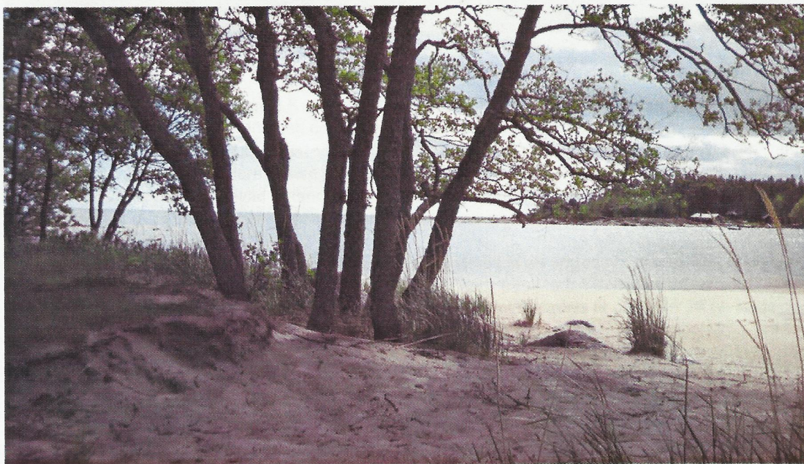
Klippor finns runt hela ön, på vissa ställen är de mycket branta och otillgängliga. Här en av få sandstränder, denna vid Kalvsundet.