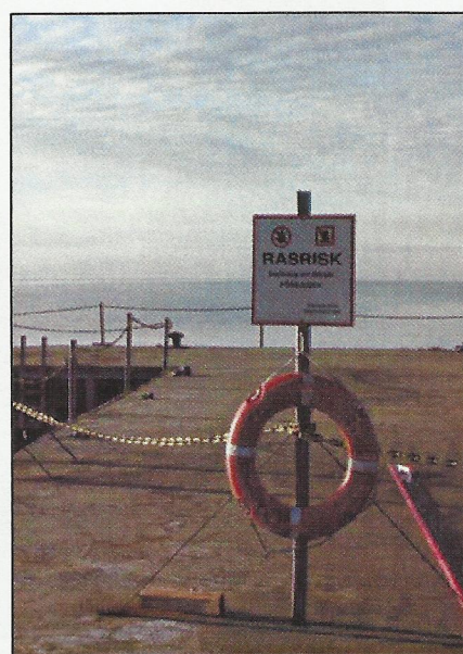
Kajen på Sanna. (Ingeli Gagner, nov 2011)

I Sanna finns en större kajläggning med status som nödhamn. Den är byggd på 1970-talet för att både militär, sommarboende och turister skulle kunna lägga till. Nu har stora delar av den kajens stålbalkssystem fränts sönder och kollapsat med påföljd att den delen av kajen kantrat och blivit obrukbar. Se bilden på första sidan. Av säkerhetsskäl är den därför avstängd vilket innebär för få platser för besökande båtar och övernattningar i hamn. Förr hade Sanna flera hundra besökare årligen, nu bara några tiotal. Efter stormen och högvattnet i december 2011 har kajens prestanda försämrats ytterligare, och nu kan man varken lossa eller lasta skogsmaskiner eller stormfällt timmer.