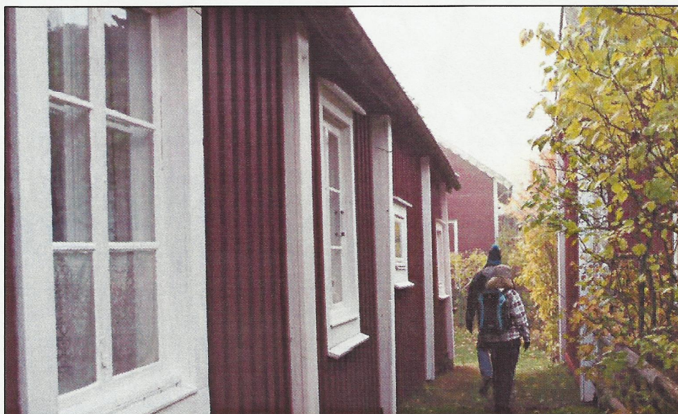
Charmiga stugor ligger tätt i Norrhamn, ett riksintresse för kulturmiljö.

Det är svårt att ta sig till Brämön utan egen båt, det är dessutom otillräckligt med kajplatser och det finns inga övernattningsmöjligheter. Men om man lyckas ta sig dit erbjuder natur- och kulturmiljöerna en oförglömlig upplevelse året om. Fiskare, lotsar, och fyrvaktare med sina familjer samt militärer har befolkat ön i olika perioder från 1500-talet. Det finns många spår kvar i miljön från forna tider, bl.a. kapellet och det lilla båtmuseet där både lots- och skötbåtar finns bevarade.