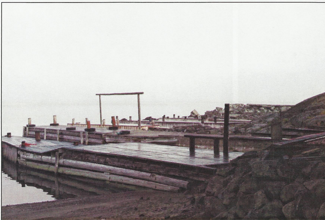
Privata bryggor vid Norrhamn, fina och välskötta men sommartid utan plats för besökande. (Foto Ingeli Gagner, nov 2011)

På norra sidan ön är landstigningsmöjligheterna för besökare om möjligt ännu sämre. Här finns enbart privata bryggor och det är svårt att ta sig in i hamnområdet för den som inte är bekant med vattnen, i synnerhet vid dåligt väder.