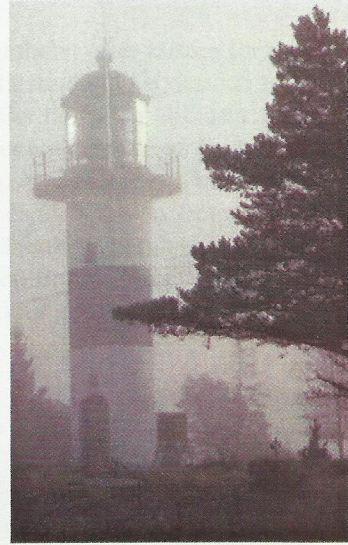
Norrhamn en dimmig dag i november.