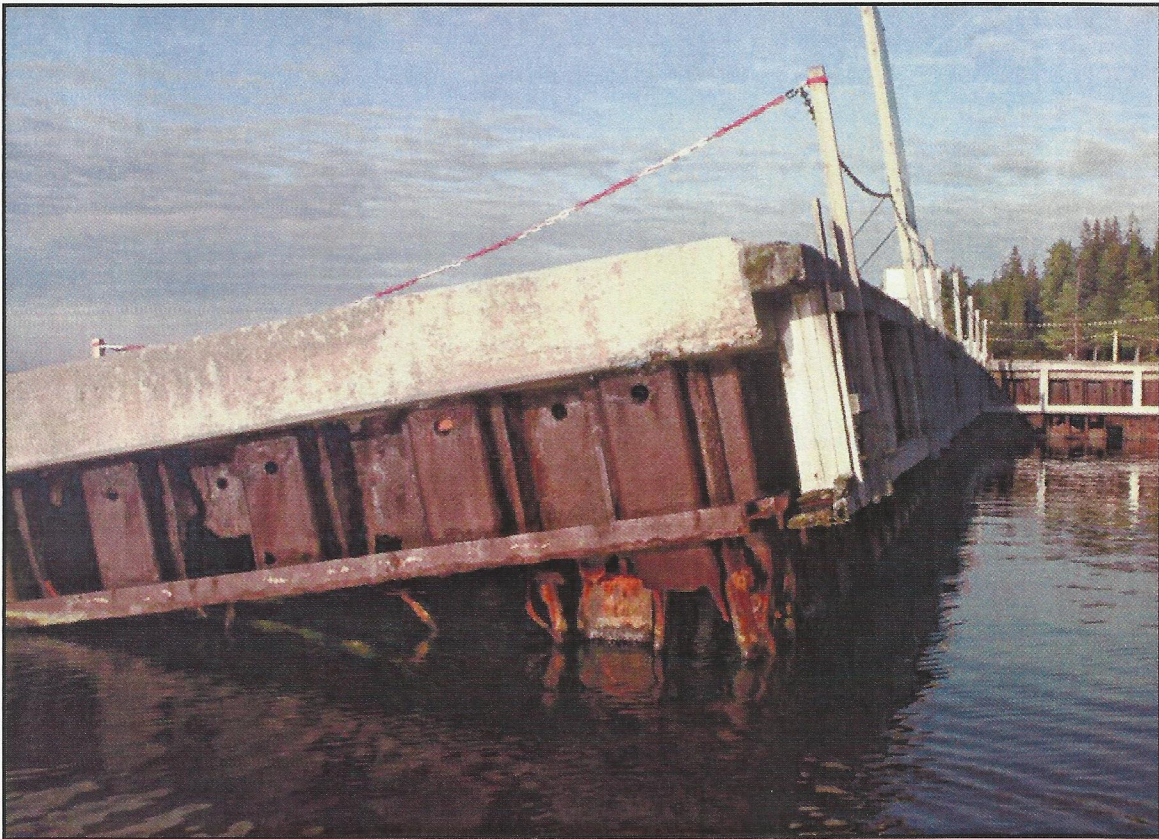
Hamnen i Sanna, november 2011

Behov av åtgärder för att tillgängliggöra kustområdet vid Löran och Brämön för besöksnäringen.